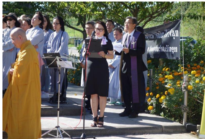
Nghi lễ cầu nguyện Thiên Chúa Giáo

Đáp lời mời của ban chấp hành Cộng Đồng, đồng đạo đồng hương và thân hữu ngoại quốc đã đến tham dự buổi lễ. Tại tượng đài, một bàn thờ với hoa quả và lư hương đã được ban tổ chức chuẩn bị chu đáo. Cờ vàng ba sọc đỏ của Việt Nam Tự Do và cờ Hoà Lan phát phới bay trong gió và gần đó một biểu ngữ với hàng chữ " Lễ Tưởng Niệm Thuyền Nhân Tỵ Nạn – Herdenking voor omgekomen bootvluchtelingen " đã tạo nên một không khí thật trang nghiêm cho buổi lễ. Sau nhiều ngày mưa gió, thời tiết Hoà Lan ngày hôm nay bỗng dưng thật đẹp với những tia nắng ấm hoà vào làn gió nhẹ tạo nên một khung cảnh thật lý tưởng cho buổi lễ.