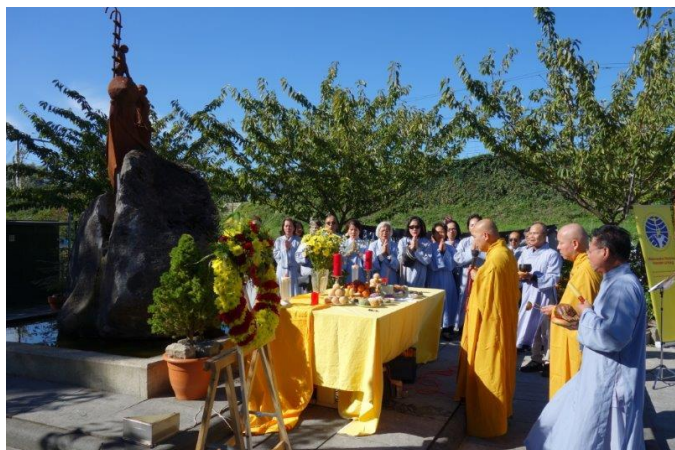
Nghi lễ cầu nguyện Phật Giáo

Hàng năm Cộng Đồng Người Việt Tỵ Nạn Cộng Sản tại Hoà Lan đều chọn tuần lễ thứ ba vào tháng 9 để tưởng niệm những thuyền nhân tử nạn trên đường vượt biển đi tìm Tự Do. Năm nay Ban Chấp Hành Cộng Đồng tổ chức lễ tưởng niệm vào ngày chủ nhật 24/9/2023 tại thành phố Almere (tượng đài thuyền nhân được đặt tại khuôn viên chùa Vạn Hạnh ở Almere).