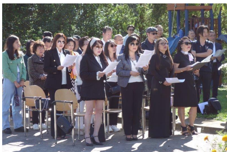
Ca đoàn Giáo Xứ Nữ Vương Các Thánh Tử Đạo Việt Nam tại Hoà Lan

Đáp lời mời của ban chấp hành Cộng Đồng, đồng đạo đồng hương và thân hữu ngoại quốc đã đến tham dự buổi lễ. Tại tượng đài, một bàn thờ với hoa quả và lư hương đã được ban tổ chức chuẩn bị chu đáo. Cờ vàng ba sọc đỏ của Việt Nam Tự Do và cờ Hoà Lan phát phới bay trong gió và gần đó một biểu ngữ với hàng chữ " Lễ Tưởng Niệm Thuyền Nhân Tỵ Nạn – Herdenking voor omgekomen bootvluchtelingen " đã tạo nên một không khí thật trang nghiêm cho buổi lễ. Sau nhiều ngày mưa gió, thời tiết Hoà Lan ngày hôm nay bỗng dưng thật đẹp với những tia nắng ấm hoà vào làn gió nhẹ tạo nên một khung cảnh thật lý tưởng cho buổi lễ.