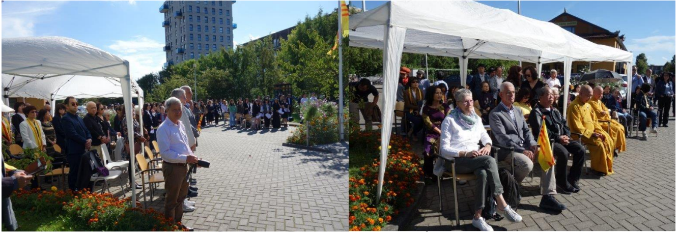
Quang cảnh đại diện các tôn giáo và quý đồng hương tham dự

Sau khi buổi lễ kết thúc, mọi người cùng dự tiệc trà thân mật. Tại hội trường, nhiều người cùng ký tên vào kiến nghị thư gửi Liên Hiệp Quốc xác định chủ quyền quần đảo Hoàng Sa của Việt Nam bị Trung Cộng chiếm đóng vào 50 năm trước.