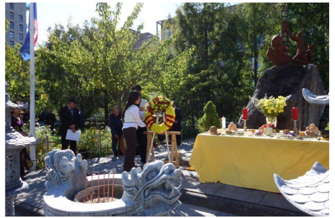
Nghi lễ dâng hoa

Sau đó, ba vị đại diện đoàn thể trong trang phục cổ truyền khăn đóng áo dài đã tiến đến bàn thờ dâng hương tưởng nhớ đến thuyền nhân tử nạn trên đường vượt biển.