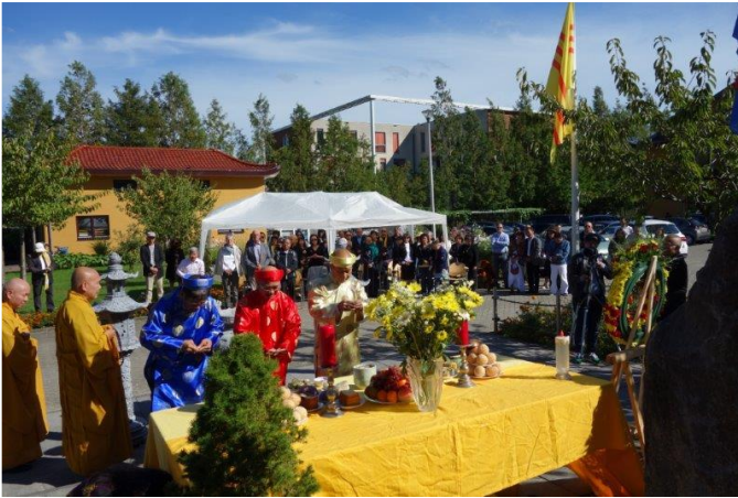
Nghi lễ dâng hương